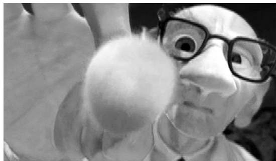
1 THE CLEANER

Effekt, der die Technologie des ray-tracing zur Schau stellt, die in TOY STORY II ausführlich zum Einsatz kam. Als nächstes fickt der Restaurator Woodys Kleidung. Wie ein Mikroskop zoomt die Kamera auf die Stofffasern und verweist damit auf das Bemühen der Computergrafik um die realistische Wiedergabe von Texturen. Sie lässt den Betrachter sogar Teil des Textils werden, wenn wir aus einer «unmöglichen» Perspektive, aus einem Riss im Körper der Puppe schauen und erleben, wie er vor unseren Augen zugenäht wird. Wenn der Cleaner zu guter Letzt Woodys Wangen mit Farbe besprüht, referiert er nicht nur auf den Pygmalionmythos; seine Handlung schafft auch einen Bezug zu einer berühmten Anekdote aus der Produktion von SNOW WHITE (Walt Disney, USA 1937): Schneewittchens Wangen mussten auf tausenden von Einzelbildern mit Hand nachgefärbt werden, nachdem Disney sie in letzter Minute als zu blass und leblos befunden hatte (Finch 1973).